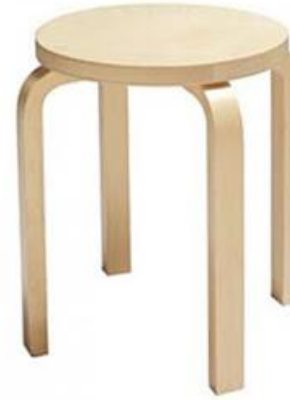
Sgabello E60 (1933) Alvar Aalto € 200,00