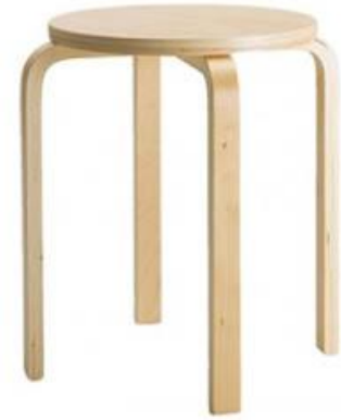
Sgabello Frosta Gillis Lundgren € 9,99